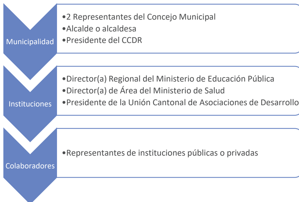
Imagen 1. Conformación de Comisión de Apoyo Local