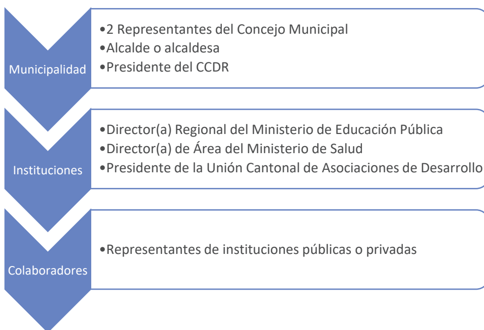
Imagen 3. Conformación de Comisión de Apoyo Local